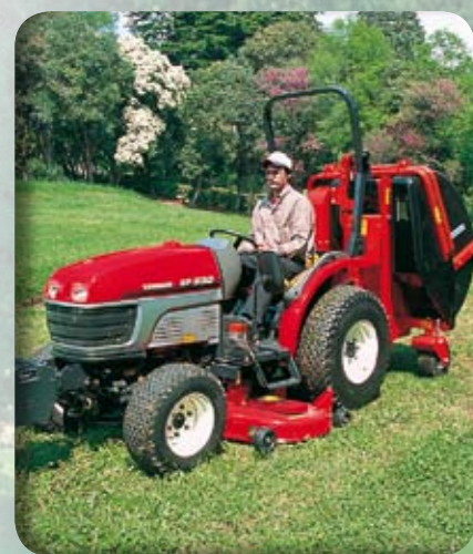
Mezinápravová sekačka a sběrací koš