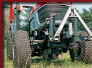
Přední PTO (spolu s předním TBZ)