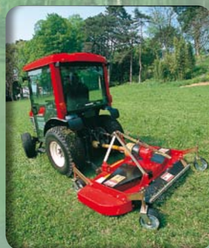
Sekačka se zadním výhozem