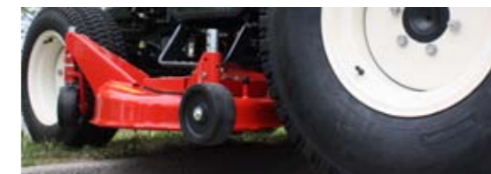
světlost 150 mm